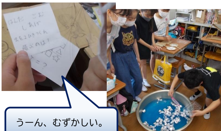
うーん、むずかしい。